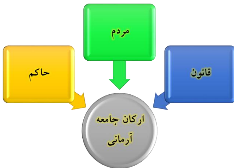
(ارکان جامعه آرمانی)